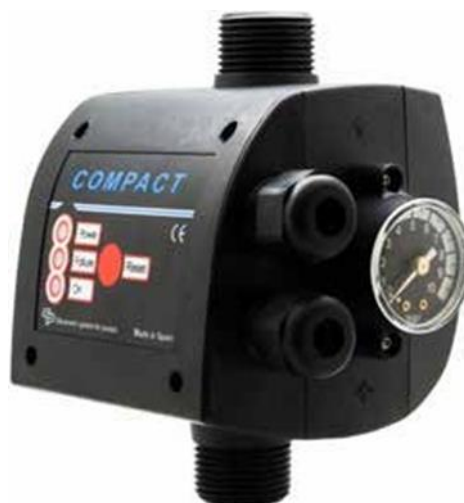
COMPACT 2 COMPACT 22

Low Voltage Directive 2014/35/EC Electromagnetic Compatibility 2014/30/EC RoHS 2011/65/EC + 2015/863/EC